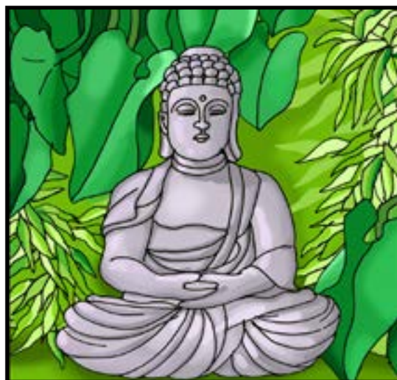
Staty av Buddha

Den som uppnår nirvana slipper återfödas enligt buddhismen.