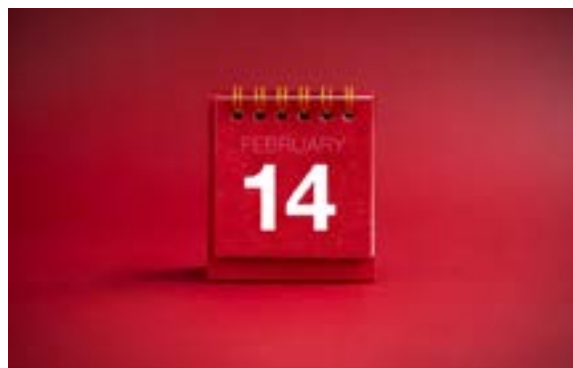
Alla hjärtans dag eller

Namnet kommer från Sankt Valentin, ett helgon som levde för nästan två tusen år sedan.