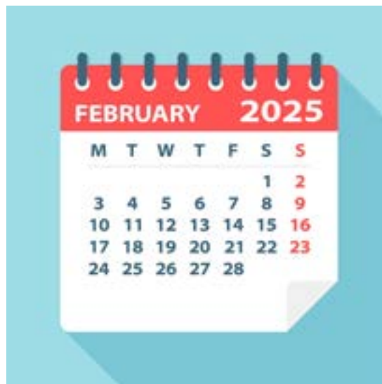
Almanacka med engelsk text