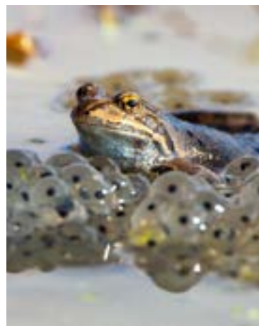
groda med ägg