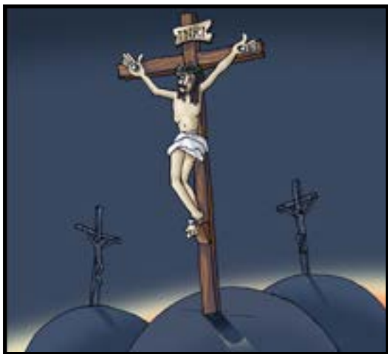
Jesus på korset

Påskhelgen består av skärtorsdagen, långfredagen, påskafton, påskdagen och annandag påsk.