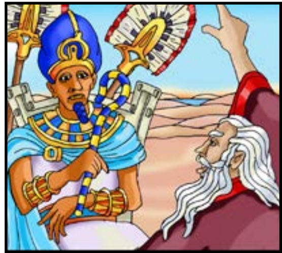
Mose och den egyptiske kungen.

Då äter man speciella rätter, bland annat bröd som inte jäst, för att påminna om den hårda tiden som slavar.